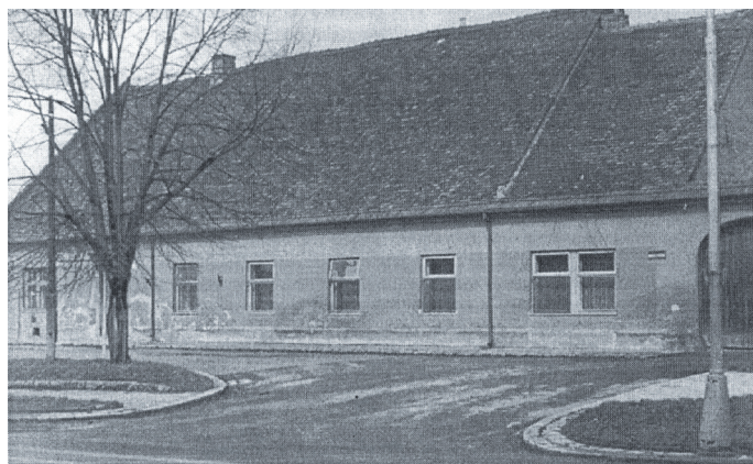
Bývalá hospoda u Orátorů v Kuřimě. Dnes na jejím místě stojí prodejna Albert